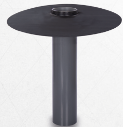
KRASO® Flanschrohr Typ FE