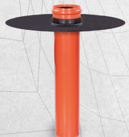
KRASO® Flanschrohr Typ KG