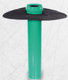
KRASO® Flanschrohr Typ KG 2000